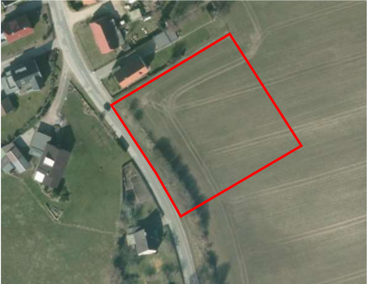
Abb.: Luftbild mit Ergänzungsbereich